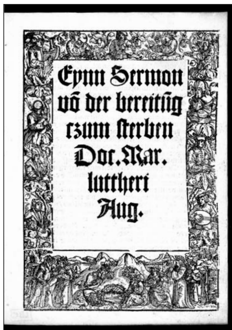
1. kép: A Bereitug egyik első kiadásának címlapja (Lipcse, 1519 – VD 16: L 6478)

Az ars moriendi tágabban tehát egy középkori, illetve középkori eredetű műfajt jelöl, amelybe a halálra felkészítő műveket soroljuk, ideértve a Canterbury Anzelmnek (1033 k. – 1109) tulajdonított ún. anzelmi kérdéseket is, amely ennek a típusnak az egyik legkorábbi példája. 8 A megjelölés szűkebb értelemben egy konkrét műre, illetve könyvcsoportra vonatkozik. A Speculum [vagy Tractatus ] artis bene moriendi a konstanzi zsinat idején (1414–1418) keletkezett. 9 Szerzője ismeretlen, de azt tudjuk, hogy háttérben Jean Gerson (1363–1429) La science de bien mourir (1408) című műve áll. (2. kép) Gerson a párizsi egyetem kancellárja és a zsinati mozgalom meghatározó alakja volt, korának egyik legnagyobb tekintélyű teológusa, aki a doctor