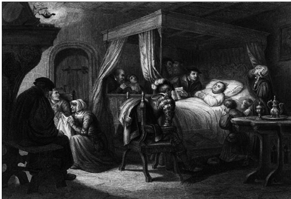
13. kép: Győzelem a halálban: Eisleben, 1546. február 18. éjszakája (F. Nargeot rézmetszete, 1860 k., Pierre-Antoine Labouchère után)

A jó halál művészete legalább egy fél évezredet ölel át (1400–1900), és Luther itt elemzett könyvecskéje mérföldkő volt ebben a történetben. Erről tanúskodnak azok a késői metszetek is, amelyek a reformátor saját halálát is ebbe a megújított ars moriendi hagyományba ágyazva ábrázolják (13. kép). A XIX. században rendkívül népszerű volt a téma; Luther utolsó óráját is