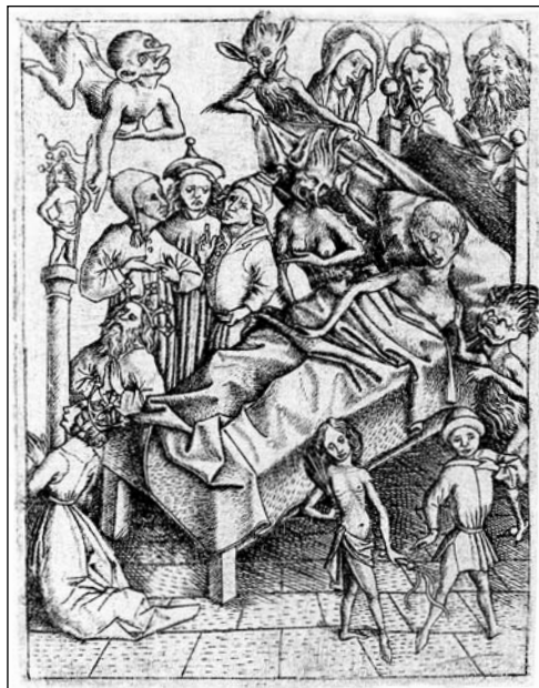
3. kép: Ars moriendi , 1/a tábla: 'A hitelenség kísértése' (E.S.mester, 1450 k.)

Az első két szakaszban Luther nagyon röviden foglalkozik a halálra készülő testi és lelki búcsúzásával. 19 Ezekről a kérdésekről ebben az összefüggésben nincs több mondanivalója. A haldoklónak már nem azzal kell foglalkoznia, amit hátrahagy, hanem az előtte álló úttal. A harmadik