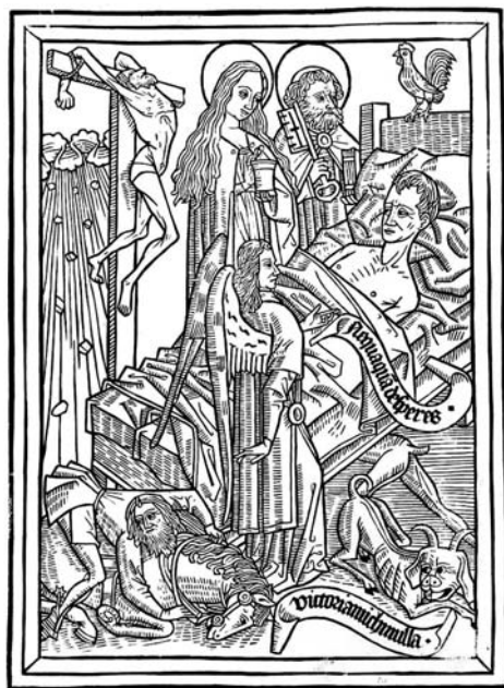
7. kép: Ars moriendi , 2/b tábla: 'A remény vigasztalása a kétségbeesés ellen' (német, 1466 k.)

A hatodik szakaszban azzal vezeti be az első nagy tematikus egységet, hogy a szentségek erejét akkor érhetjük meg legjobban, ha tudjuk, mivel szemben vannak segítségünkre. Luther kimondatlan előfeltevése, hogy minél nagyobb a rossz, amitől megvédenek, annál hálásabbak leszünk a segítségért, amelyet annak legyőzéséhez kapunk, és annál jobban fogjuk tisztelni a szentségeket, amelyek ebben erősítenek. A fenyegetést három képben foglalja össze, amelyeknek egy-egy szakaszt szentel. Ezek a haldoklóra törő kísértések. A halál képe hűtlenné tesz Istenhez