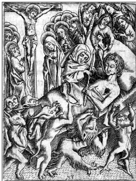
12. kép: Ars moriendi , 6. tábla: 'Győzelem minden kísértés felett a halál órájában' (M.Z. mester, 1500–1510 k.)

csolnak be a szentségek – készítette elő már korábban Luther a témát [15]. Igaz, hogy senki nem halhatja a mi halálunkat 28 – de ugyanilyen fontos, hogy halálunkban sem vagyunk egyedül. A halállal magunknak, de nem magunkban, nem egyedül kell szembenéznünk. Az illusztrált ars moriendik utolsó képén, a kísértés fölötti végső győzelmet ábrázoló tizenegyedik (6. sz.) metszeten egy apró emberalakot – a haldoklóból éppen távozó lelket – angyalok és szentek csoportja veszi magához (11–12. kép). Ezt a pillanatot Luther is megragadja a sermóban : „Ha