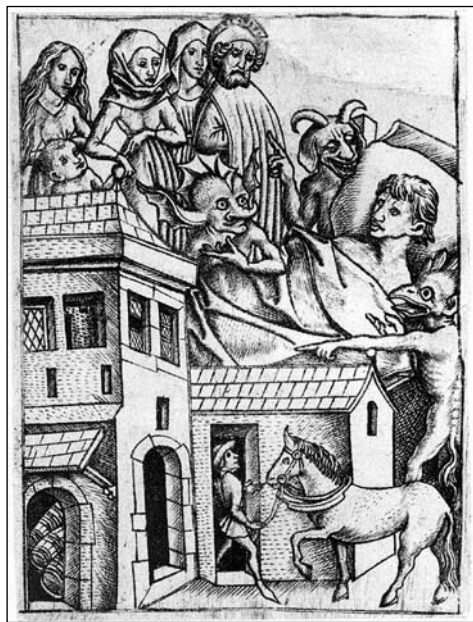
9. kép: Ars moriendi , 5/a tábla: 'A múlt javak (kapzsiság) kísértése' (E.S. mester, 1450 k.)

A párhuzamok a Speculum 2. fejezetével nyilvánvalók. Szerkezetileg is hasonló helyen – a bevezetés után – bukkan fel a két szövegben ugyanaz a téma, és mindkét esetben ez