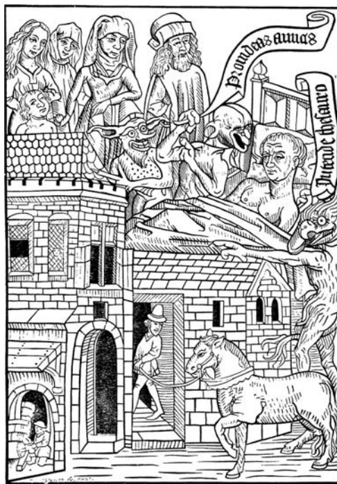
10. kép: Ars moriendi , 5/a tábla: 'A múlt javak (kapzsiság) kísértése' (francia, 1465)

a legnagyobb terjedelmű egység. Igaz, hogy a kísértések száma a XV. századi ötről Luthernél háromra csökken, 22 de ezek közül az első kettő nála is a hitetlenség (3. kép) és a kétségbeesés (5. kép). Amikor a reformátor képekről beszél, valószínűleg nem is egyszerűen metaforákat használ vagy a haldokló pszichés élményeire, látomásaira utal, hanem az illusztrált ars moriendi k általánosan ismert fanyomataira is gondol. Ezekkel egész közeli ikonográfiai párhuzamokat is megfigyelhetünk a következő szakaszokban.