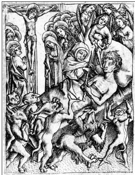
11. kép: Ars moriendi , 6. tábla: 'Győzelem minden kísértés felett a halál órájában' (E.S. mester, 1450 k.)

Több új elemet tartalmaz a sermo utolsó nagyobb egysége, ahol három szakaszból ket- tőben Luther olyan témákat emel ki, amelyek addig legfőljebb visszafogottan voltak jelen. Mindkettő közeli rokonságot mutat a középkori hagyománnyal. A tizennyolcadik szakasz a szentek közösségével foglalkozik. Ebbe kap-