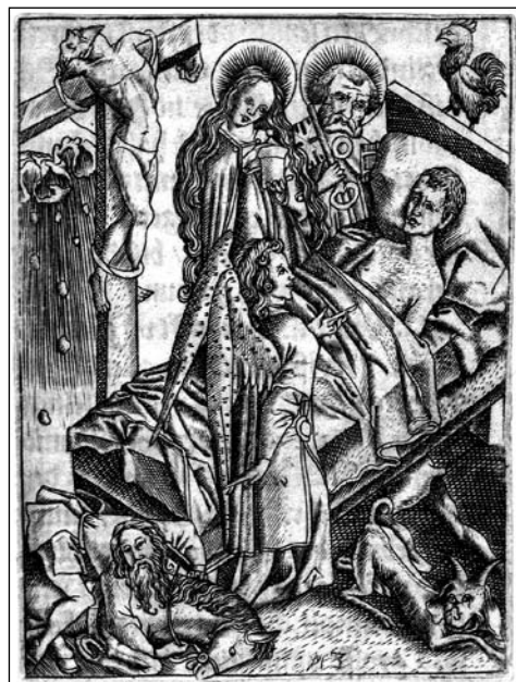
8. kép: Ars moriendi , 2/b tábla: 'A remény vigasztalása a kétségbeesés ellen' (M.Z. mester, 1500–1510 k.)