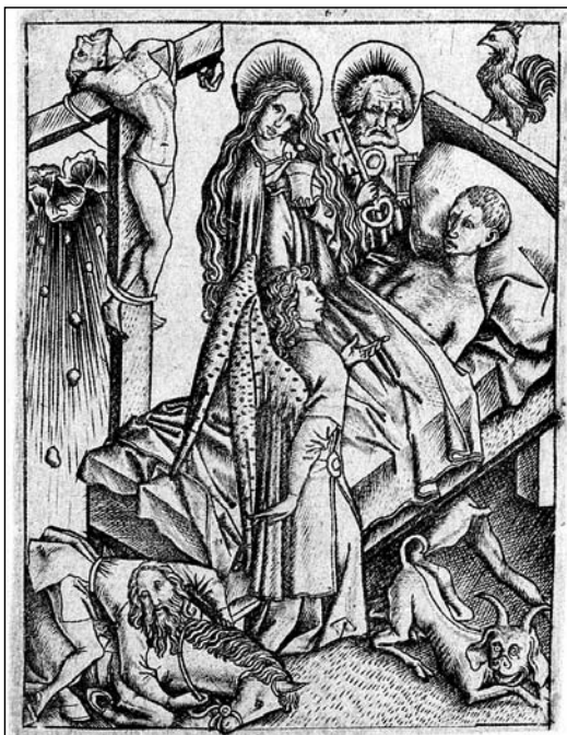
6. kép: Ars moriendi , 2/b tábla: 'A remény vigasztalása a kétségbeesés ellen' (E.S. mester, 1450 k.)

A sermónak ez a bevezető része sok szempontból rokonítható a Speculum 1. fejezetével. Luther is a halál értelmezésével, isteni rendbe illesztésével indítja a gondolatmenetet, és nála is az utóbbi alapozza meg a rémisztő kilátás átértékelését. Egyúttal ő is hangsúlyozza, hogy a meghalásra fel kell készülni: végső soron tehát az ő sermója is annak a lelkipásztori-teológiai