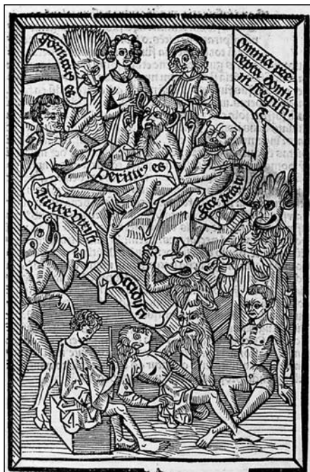
5. kép: Ars moriendi , 2/a tábla: 'A kétségbeesés kísértése' (Lipcse, 1500 k.)

az utolsó kenetet is szentségnek tekinti, 20 azonban hangsúlyozza, hogy a szentségek vételénél a hit a legfontosabb mozzanat. A szentségek tisztelete – gondoljunk az úrnapi körmenetek és a szentségimádás elterjedésére a XIII. század után – a késő középkori vallásgyakorlás alapvető mozzanata, amit Luther és első olvasói is magától értődőnek tekintettek. A reformátor azonban semmiképpen nem a külső gesztusokban, hanem a hitben látja a tiszteletadás kulcsát. „A tisztelet abban áll, hogy én hiszem azt, hogy igaz, és meg is történik velem mindaz, amit a szentség jelent, amit Isten benne mond és megmutat” [5].