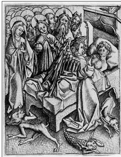
4. kép: Ars moriendi , 1/b tábla: 'A hit vigasztalása a hitelenség ellen' (E.S.mester, 1450 k.)

bekezdés néhány erőteljes képpel átértelmezi a halált. Olyan az, mint a szülőcsatorna, amely szűk, szoros és sötét, de az életre és a korábbinál – a metafora szintjén az anyaméhénél – összehasonlíthatatlanul tágabb és szebb világra vezet. Erre az útra azonban fel kell készülni, aminek legjobb eszköze a szentségek vétele [4]. Luther az úrvacsora mellett ekkor még a gyónást és